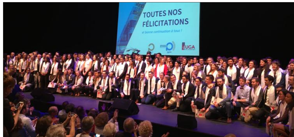
Les étudiants de Polytech Grenoble sur la scène de l'Heure bleue durant la cérémonie de leur remise de diplôme.

C'est sur des titres de U2, Scorpion, Ben E. King ou encore Pink Floyd, joués par les étudiants du Bureau des arts de Polytech Grenoble, que la salle de L'heure bleue s'est rapidement remplie vendredi, en début d'après-midi.