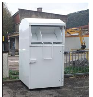
Les habitants peuvent déposer leurs textiles place du 8-Mai-1945, ou à l'arrêt Prémol, ou encore dans la zone d'activités Champ-Fila.

Une démarche écologique globale, qui aurait permis à