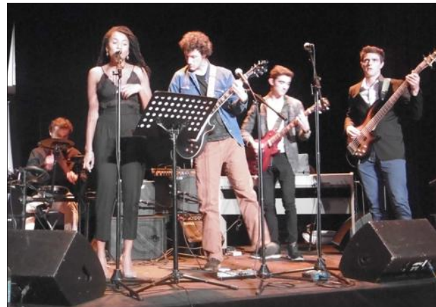
Les étudiants du bureau des arts jouant des titres de rock en ouverture de la cérémonie de remise des diplômes des ingénieurs de Polytech Grenoble.