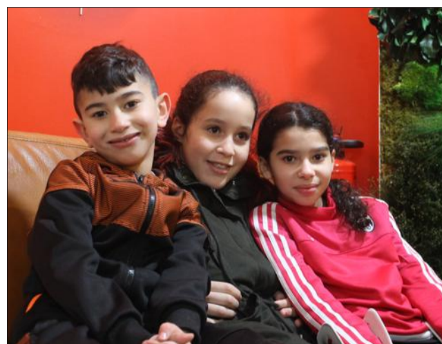
A gauche, les enfants étaient aussi de la fête ; les barmen du "Bistrot" ; sur le buffet, le public a pu tester de délicieuses spécialités végétales et fromagères.