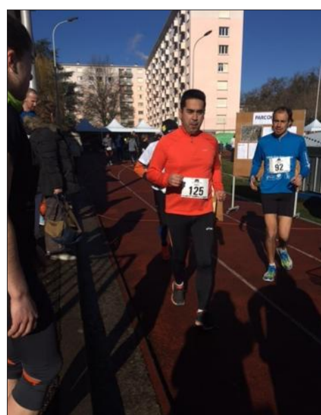
Dimanche, sous un soleil radieux, le club ESSM Athlétisme organisait la première édition des "10 km de Saint-Martin-d'Hères", en collaboration avec la Ville.